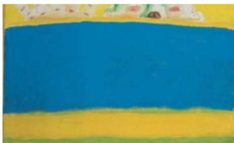
Obrázek Hlava za řekou reflektuje malířovu krizi z 80. let, kterou řešil skleničkou. |