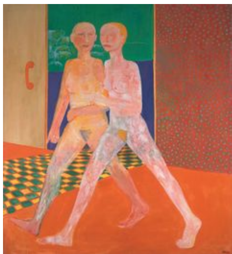
Jiří Sopko: Dámičky (opět), 1972, olej, plátno, 200 x 180, Galerie Gema.

Právě tady jsou představeny největší obrazy jako Dámičky (opět), dvojice kráčeících nahých žen namalovaná v roce 1972, triptych Rudá lázeň z roku 1990 nebo Velké koupání. Silueta, jejíž poprsí přechuhuje horní okraj obrazu z roku 1992, se ráchá ve zlatavé vodě evokující rybník při západu slunce.